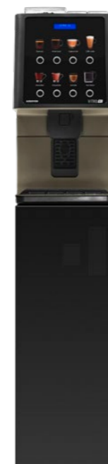
Kit peana Preparada para para validador de monedas. (850 mm.)

Para servicio de café en tiendas de conveniencia también es la solución perfecta y para los hoteles, donde el desayuno debe ser bueno, pero igualmente rápido, ofrece una experiencia agradable, con un diseño atractivo, sencillo y funcional.