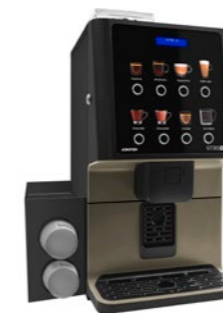
Kit módulo de vasos Para dispensar vasos.