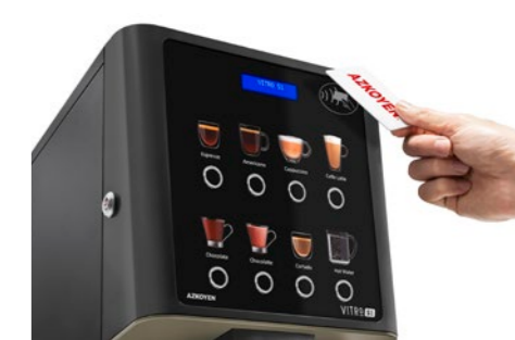
Kit Lector RFID Para tarjeta de recarga producto o sistemas cashless.