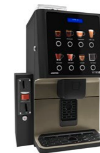
Kit módulo validador Preparado para instalar un validador de monedas.